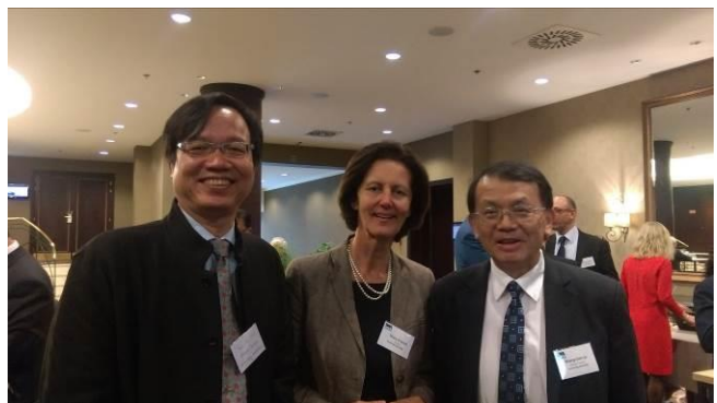
圖 5 我國代表與 IWA 現任會長(Kroiss 教授)合照 圖 6 我國代表與下任會長(D'Arras 女士)合照

本次大會另一項重頭戲為選擇 2020 年水大會主辦城市，本次共有包括丹麥哥本哈根市、捷克布拉格市、及英國蘇格蘭 Glasgow 三個城市送件申請，經過 IWA 代表現場訪視，以及 2015 年 6 月 IWA 執行長、及常務理事會會議，捷克布拉格市退出參選，因此由哥本哈根市及 Glasgow 市提出最終計畫書。2015 年 10