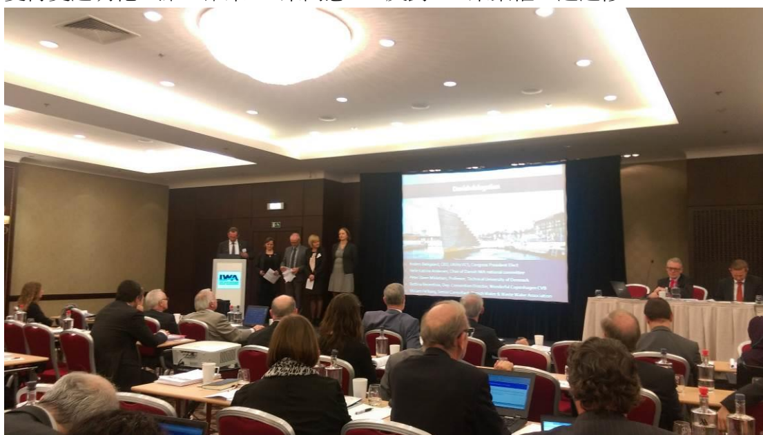
圖 7 哥本哈根團隊報告籌備 2020 雙年會

上午最後一項工作為修改 IWA 章程，主要是希望將各主要成員選舉方式，變得更透明化一點。結果 42 票同意、0 反對、1 票棄權，通過修正。