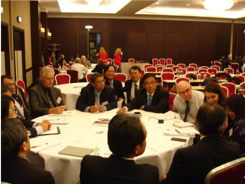
圖 8 理事會與策略委員會聯合會議一角