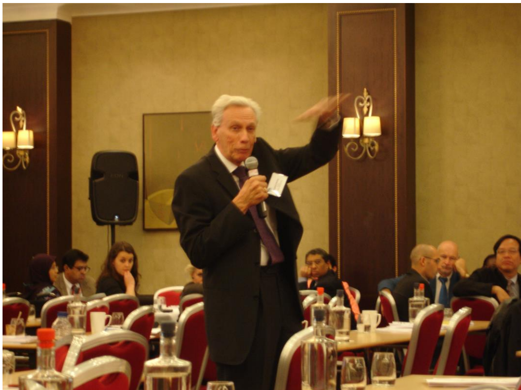
圖 9 IWA 現任會長(Kroiss 教授)在理事會與策略委員會聯合會議作結束前演講

下午第二場分組則主要討論虛擬 IWA 的方向、以及跨行業合作等二個議題，限於時間，各組選一個議題討論，本組則討論虛擬 IWA 的方向。會中參與