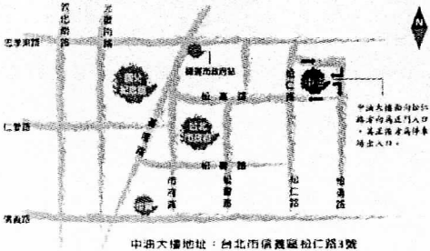
中油大樓地址：台北市信義區松仁路3號