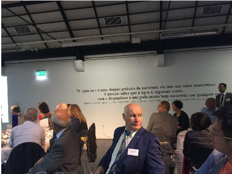
圖 3：IWA 理事會晚宴情形