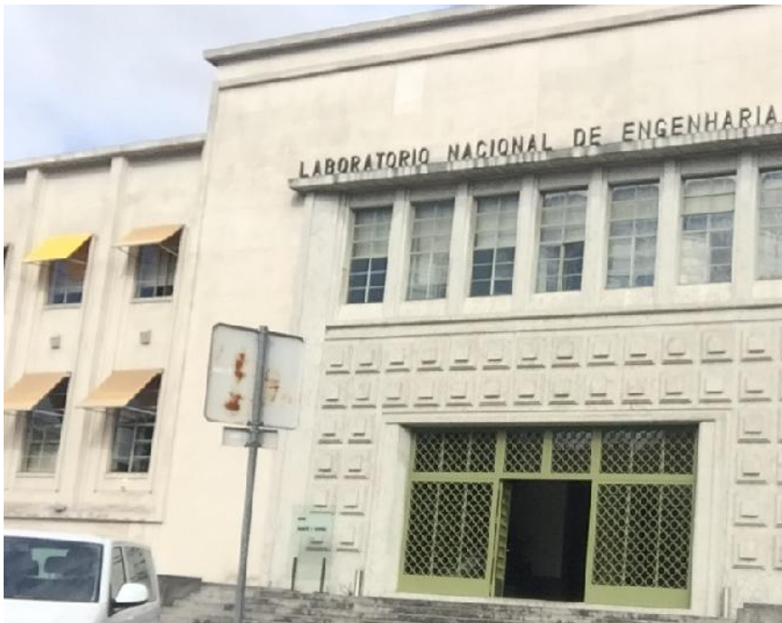
圖 1：葡萄牙國家土木工程實驗室