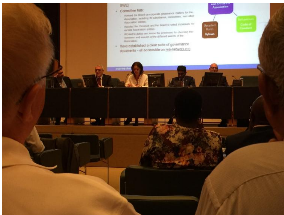
圖 3：理事大會(Governing Assembly)開會情形