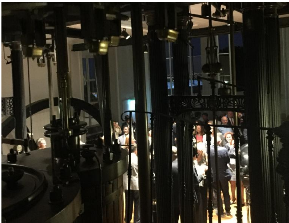
圖 2：交誼雞尾酒會於自來水博物館百年抽水機房內舉行

由於今年恰逢 IWA 成立 20 週年，IWA 會長 Diane d' Arras 女士於 10 月 4 日晚里斯本自來水廠博物館內舉辦晚宴。晚宴前的交誼雞尾酒會在加壓機房內舉行(如圖 2)，在交誼過程中，主辦單位特別操作具有百餘年歷史的蒸汽式加壓設備供與會者參觀，以了解葡萄牙百餘年前的工藝技術及自來水業者對設備維護管理的用心。各國代表進場前之雞尾酒接待時仍展示給各國代表觀賞。晚宴中除會長 Diane d' Arras 女士及里斯本主辦單位致歡迎詞外，亦由 IWA 秘書長 Kala Vairavamoorthy 說明 IWA 之歷史發展及工作重點。特別說明的是舉辦晚宴的場所具有百年歷史，並由牆上的文字的意思「水不是大自然的免費禮物，有時甚至是稀有而昂貴的。」，期許與會人員共同為水務工作的永續經營而努力(如圖 3)。